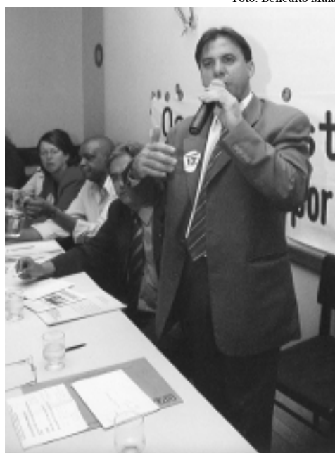
Visita do ministro Luiz Marinho a BH

denunciaram que o governo, através da direção da Cemig, trata com violência os movimentos sociais e sindicais. As