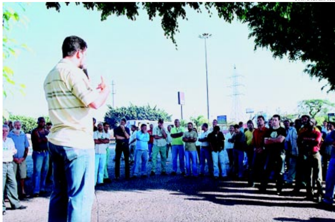
Com transparência, o sindicato discute o odontológico em reuniões setoriais

Um dos mais graves aspectos é o fato do Subprograma Odontológico não ter sido aprovado no Comitê do PSI, que é o