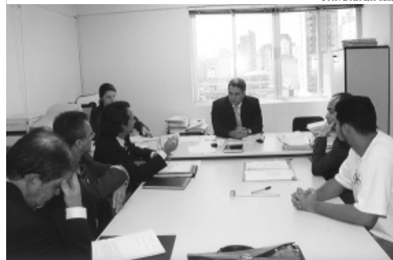
Forluz e Cemig foram questionadas por irregularidades no plano

O Sindieletro manteve na audiência sua posição contrária à postura equivocada da Forluz e da Cemig na condução do Subprograma Odontológico.