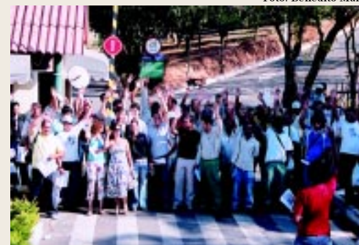
Assembleias aprovaram as reivindicações