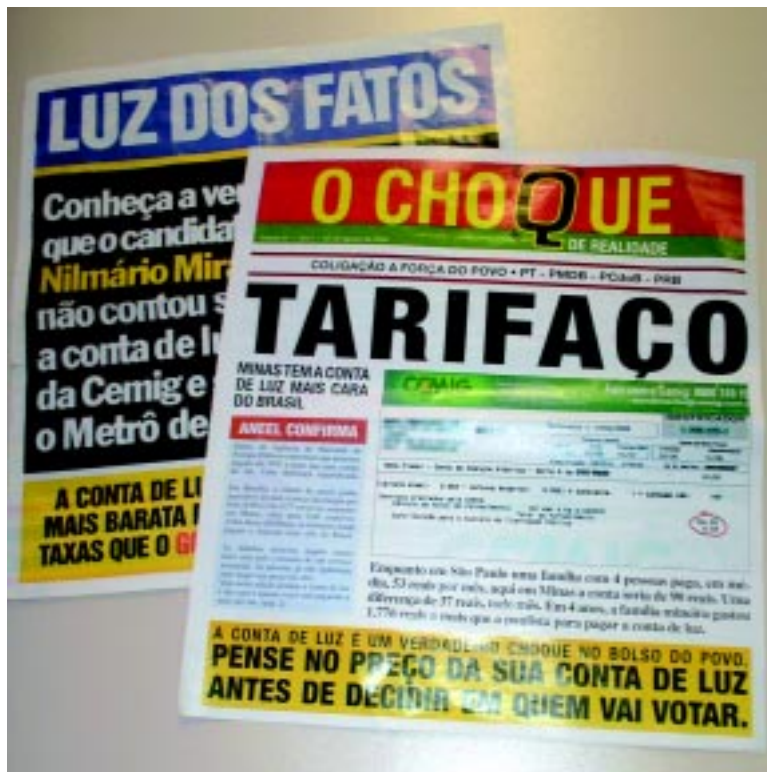
Jornais de campanha alimentam debate sobre a tarifa de energia

“As pessoas não estão conseguindo pagar a conta. Isso aumenta o índice de inadimplência e inibe o consumo. Tanto é que Minas Gerais tem um dos mais baixos ín-