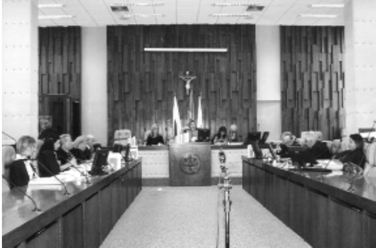
Decisão do Tribunal Regional do Trabalho pode ser revertida

Além de estudar outras medidas jurídicas cabíveis e realizar novas reuniões setoriais com os trabalhadores de empreiteiras, o Sindieletro vai recorrer da decisão da Seção Especializada de Dissídios Coletivos