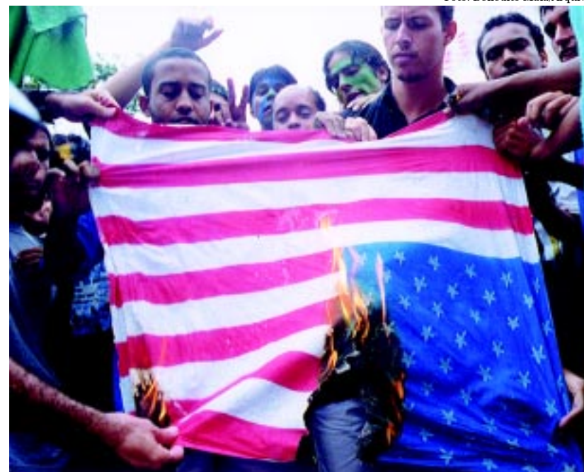
Sociedade responsabiliza governo americano pela violência

AFP – Recentemente, o secretário americano da Defesa, Donald Rumsfeld, classificou de medíocre e lamentável a atuação dos EUA na guerra ideológica