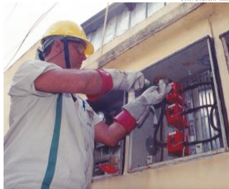
Electricistas correm maior risco com trabalho isolado

Agora, outro problema se avizinha. O treinamento que a Cemig está oferecendo aos trabalhadores está sendo feito por técnico de segurança, quando a orientação do Crea é que o curso sobre a NR 10 seja coordenado por um engenheiro elétrico com especialização em saúde e segurança.