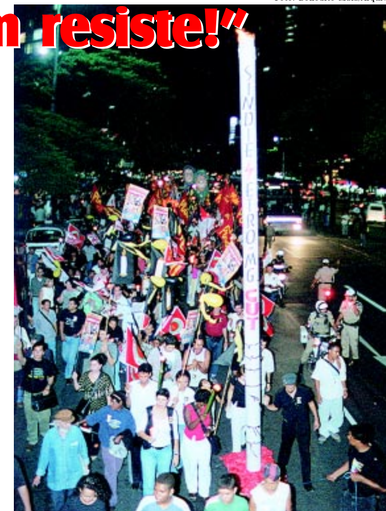
Vela gigante mostra vigilância contra apagão e corrupção