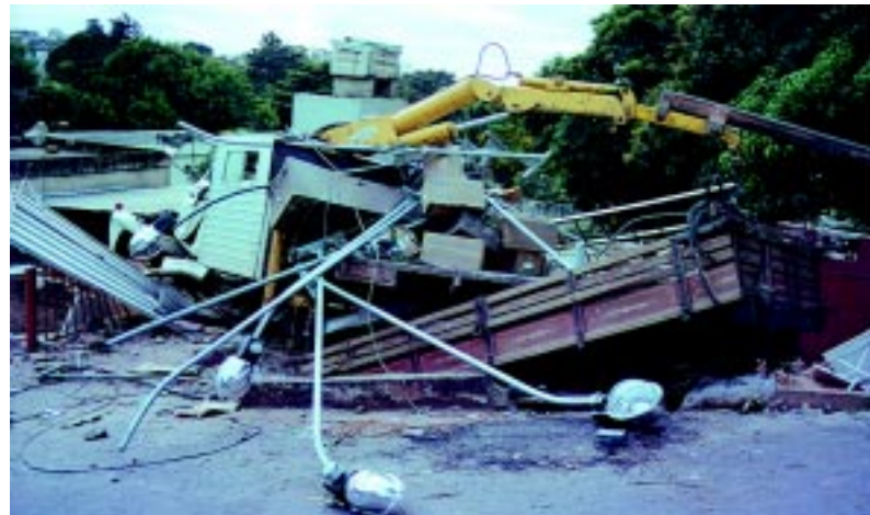
Acidente com caminhão da Hertz Empreiteira, em 2001