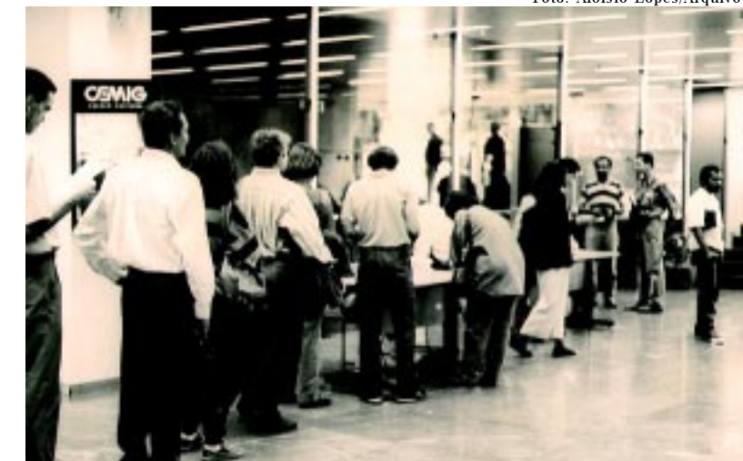
Primeira eleição para Conselho de Curadores da Forluz, em 1993