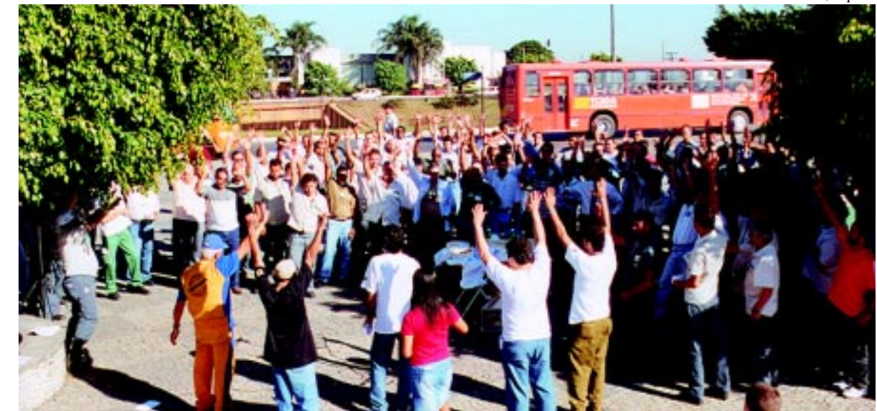
Paralisação dos eletricitários na Praça da Cemig cobrou definição do novo Plano de Saúde

A Forluz, criada em 1972, passou a contar com a participação dos trabalhadores na sua gestão pouco a pouco. Na época, a categoria não tinha nenhum representante na Fundação e as decisões eram tomadas unicamente pela direção da Cemig. No início dos anos 80, a mobilização dos trabalhadores fez com que um representante fosse indicado pela própria empresa.