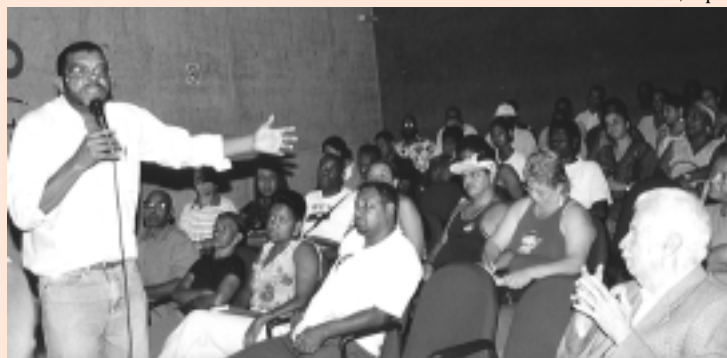
CUT-MG puxou debates sobre igualdade com outras entidades

A distorção se mantém também quando se compara