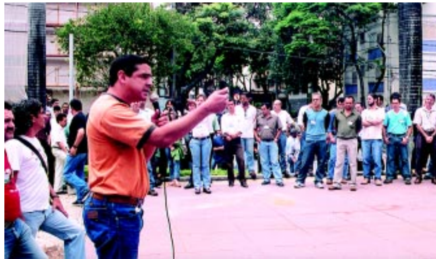
Categoria se faz presente nas setoriais e confirma a defesa coletiva da pauta

necessidade de todos os profissionais terem acesso a um Auxílio-educação digno. “Para ser eletricitista precisa saber de administração, só para trocar fusível e lâmpada? Eu só queria entender”, disse deixando os representantes das entidades perplexos.