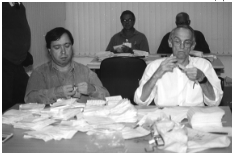
Eleição é marco na história da Forluz