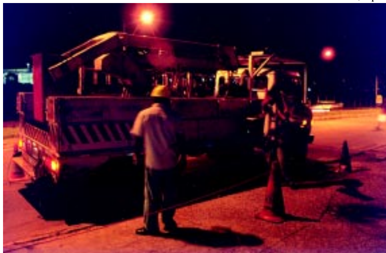
Trabalho noturno e condições desfavoráveis penalizam eletricitistas

Ao longo dos quase 60 anos de história da organização dos eletricitários, o que a categoria conquistou de melhores condições de trabalho a Cemig, agora, tenta retirar com todo o seu autoritarismo. Exemplo disso foi a conquista do turno ininterrupto de revezamento de seis horas com escalas alternativas 5X3, 5X3 e 5X4 no ACT 1989/1990 e que, em 1997, a empresa confiscou com a imposição da escala 6X3. Além de menos folga, os trabalhadores foram obrigados a trabalhar 150 horas a mais por ano, de graça. Outro exemplo foi a decisão unilateral do horário diferenciado. Ambas as imposições, para cobrir a falta de pessoal, são irregularidades e já foram denun-