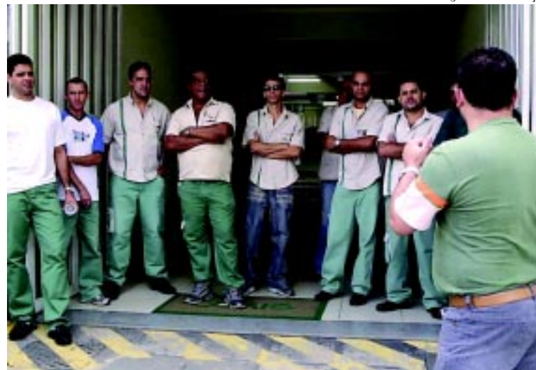
Diretor debate Campanha com trabalhadores da região