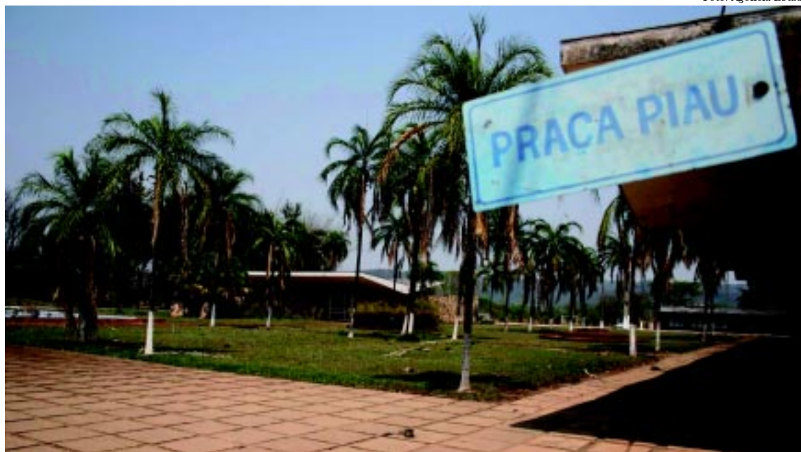
Automação da usina e enxugamento do quadro de pessoal criaram “cidade fantasma”