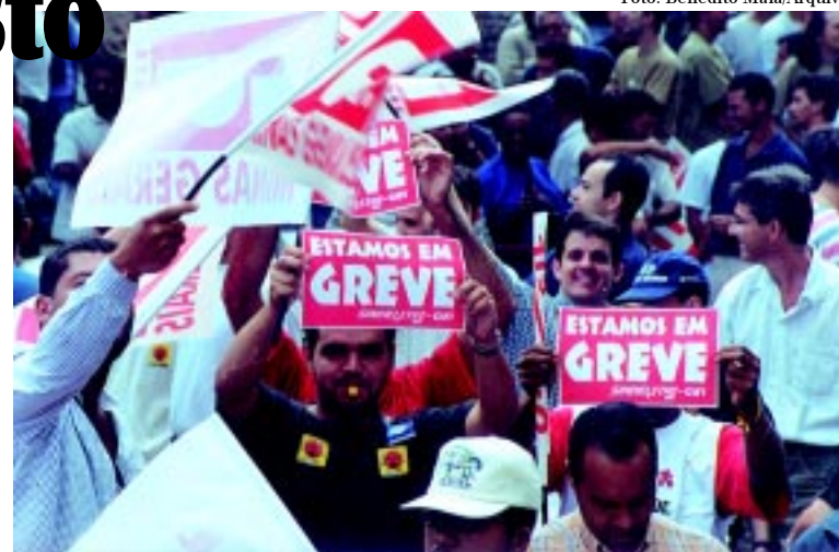
Sindieletro acredita que trabalhadores devem ter autonomia para construir a sua organização sindical

O Sindieletro, no entanto, desde sua filiação à CUT, em 1989, defende o fim da contribuição obrigatória por entender