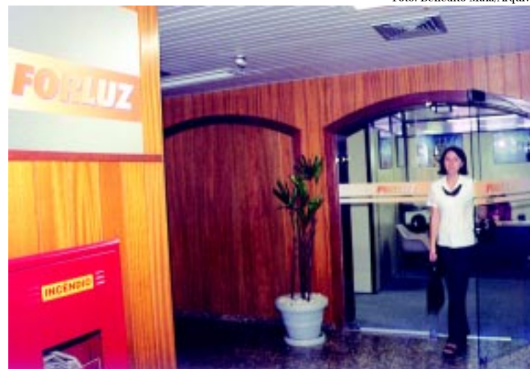
Participantes devem debater com Forluz o destino do superávit

Plínio lembra, no entanto, que a distribuição para os eletricitários depende, também, do acerto de parcela da dívida da Cemig com a Forluz, referente ao contrato realizado para saldar o Plano A. Ele acredita