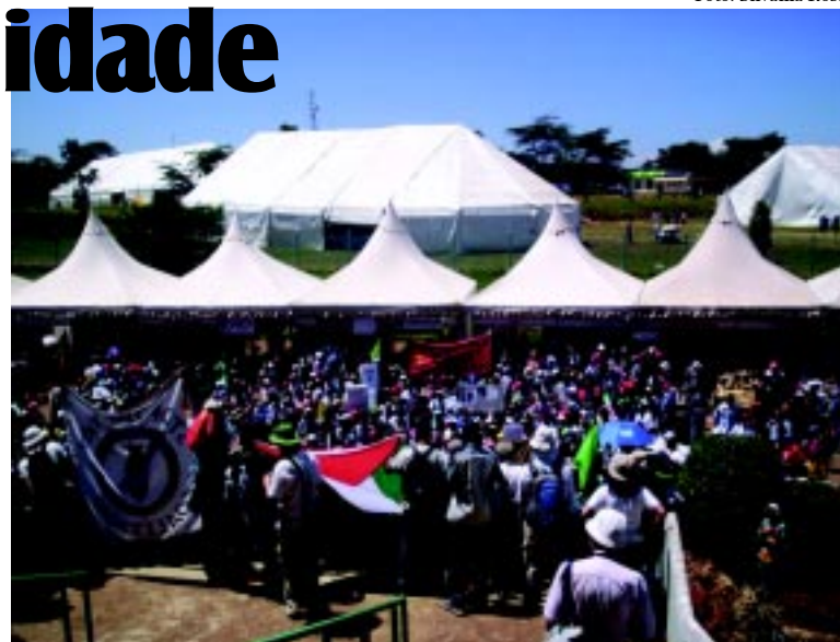
Participantes discutiram alternativas para África e para o mundo

Segundo a Agência de Notícias Carta Maior, cerca de 15 mil pessoas participaram da marcha mostrando que a África não deve ser estigmatizada como um caos de pobreza, dependente da solidariedade do mundo desenvolvido, mas, sim uma região com um histórico