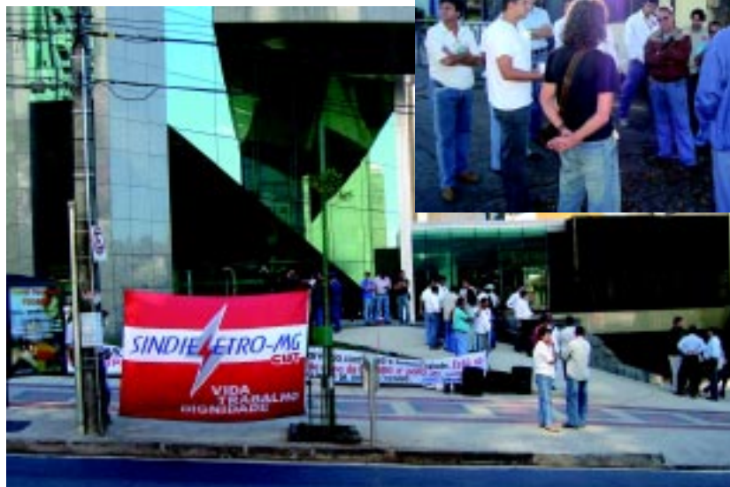
Pessoal que está na Gasmig recebe apoio dos colegas na Cemig