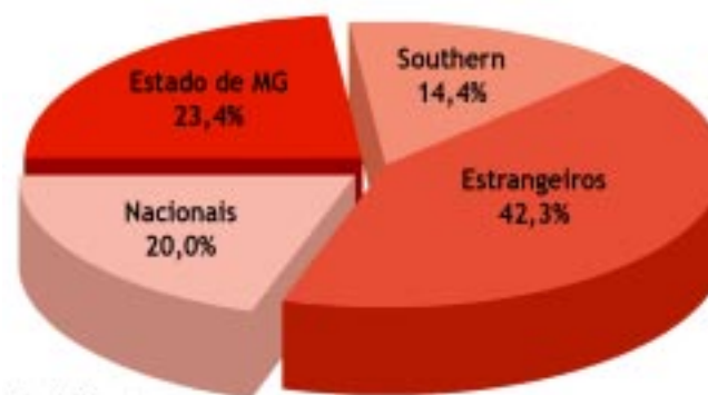
Estrutura acionária da Cemig - Dezembro/2006

Nota: Considerando o total de ações Elaboração: Subseção Dícese/Sindieletro-MG