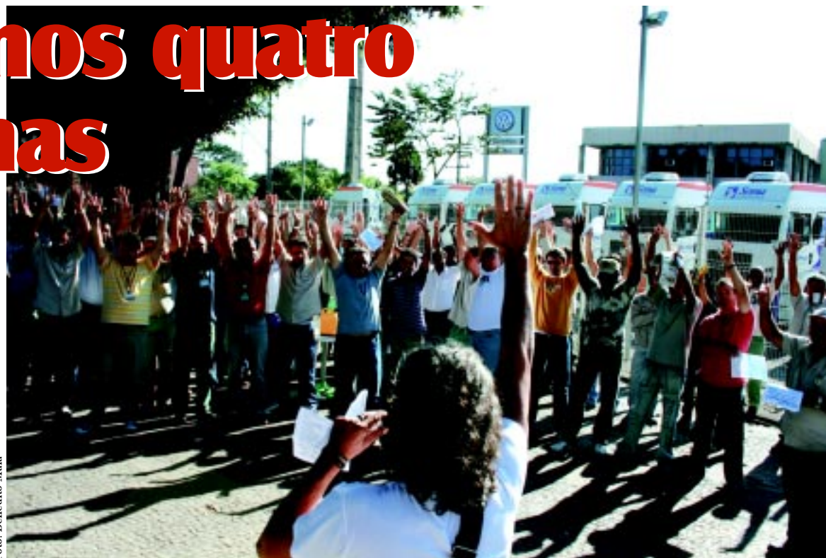
Trabalhadores da Cidade Industrial aprovam a Pauta de Reivindicações para o ACT 2007/08

Nas assembléias do Vale do Aço os debates relacionaram as dificuldades vividas pelos eletricitários com a gestão equivocada da Cemig.