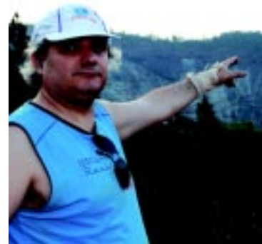
Wegton: uma história de dedicação e injustiças

Recentemente a empresa anunciou a prorrogação das atividades na cidade por mais 70 anos. A afirmação pode ter sido usada para justificar o pedido